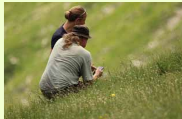
Layout: Felix Riegel, München