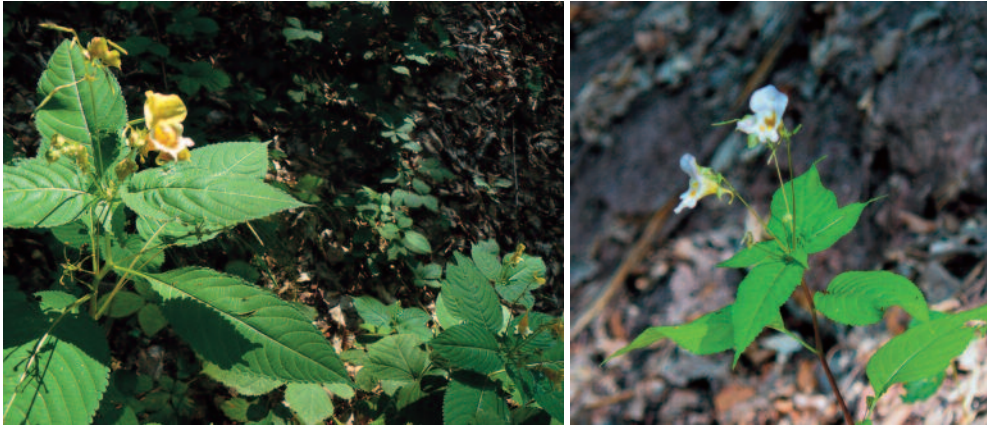
Abb. 1: Impatiens edgeworthii mit gelber und weißer Kronenfärbung am Setzbachgrund.