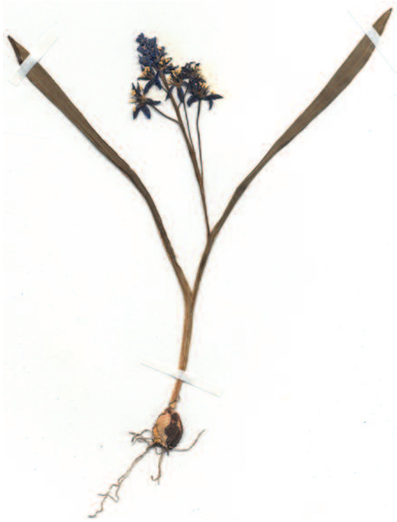
Abb. 5: Herbarbeleg von Scilla xanthandra vom Alten Friedhof Karlstadt aus dem Herbarium Dunkel.