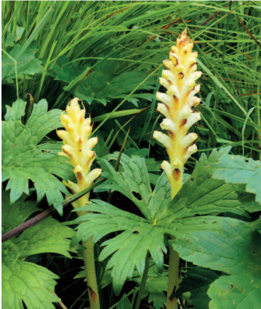
Abb. 2: Orobanche lycoctoni zwischen den Blättern der Wirtspflanze Aconitum lycoctonum im Gebiet der Reiter Alm, Berchtesgaden, 14.07.2020.