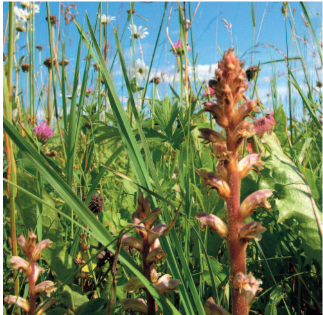
Abb. 3: Orobanche minor in einer Wiese im Westen von Landsberg, 24.06.2007.