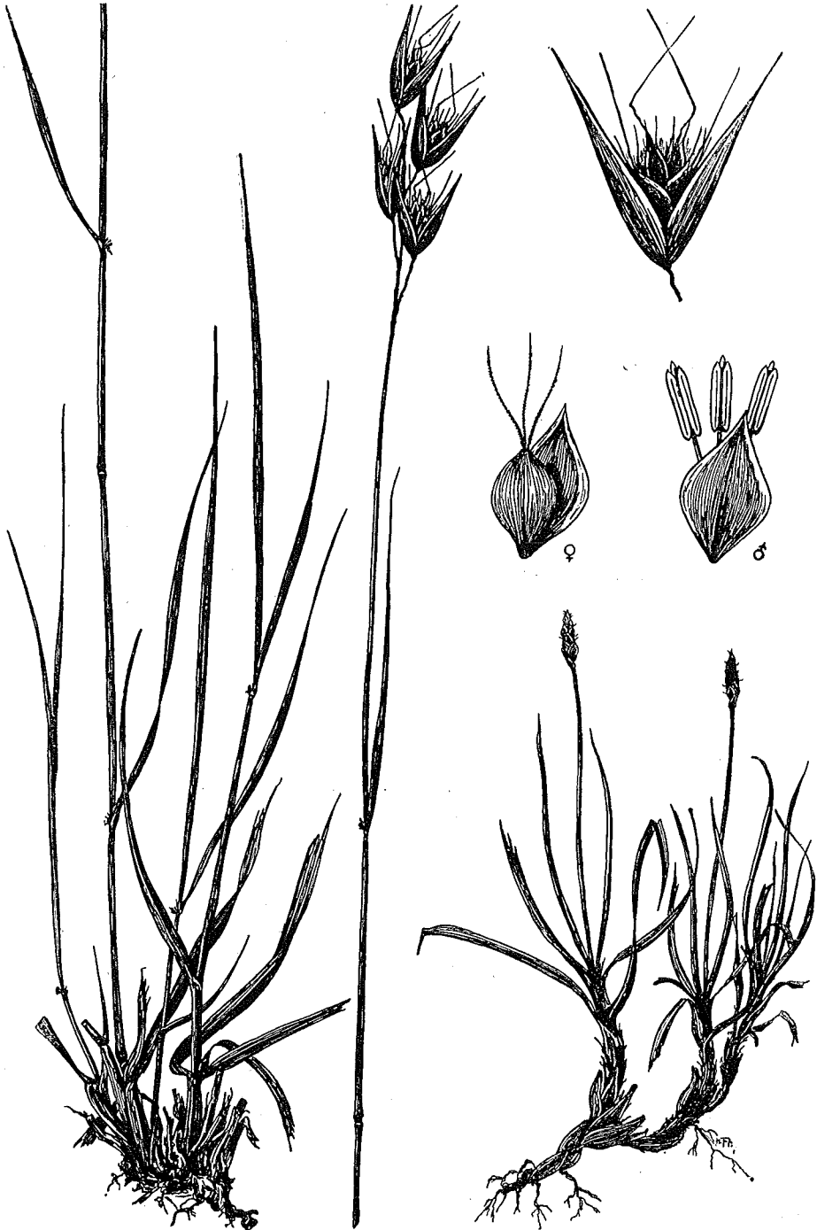
Danthonia calycina (Willd.) Rchb.