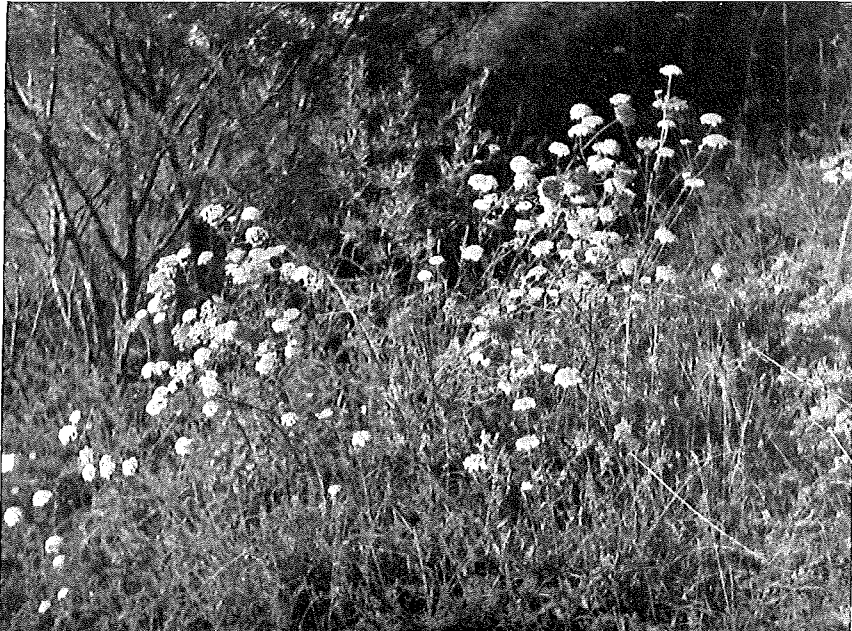
Abb. 2. Feldschicht des Steppenheide-Eichenwaldes auf der Schaftlacher Endmoräne. Hier vorwiegend Anthericum ramosum mit Peucedanum Oreoselinum .