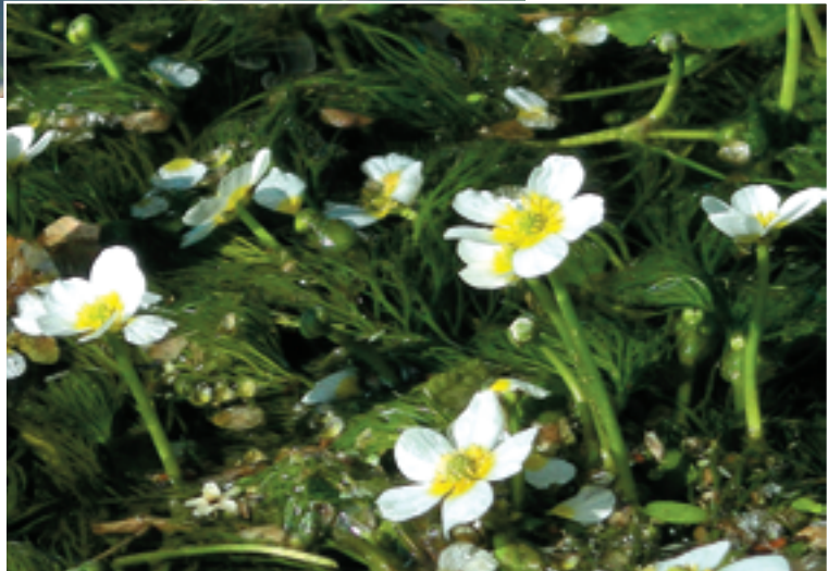
Abb. 2 (rechts): Ranunculus penicilla- tus ssp. pseudofluitans in der Memminger Ach nördlich Amen- dingen (Ganshalde), 17.6.2012.

Die Nektardrüsen an der Basis der Blütenblätter weisen bei allen Formen durchweg kreisförmige Gestalt auf. Dieses Merkmal wird in der Literatur (STACE 1997, OBERDORFER 1979, PIGNATTI 1982) für Ranunculus aquatilis L. angegeben, während die Nektardrüsen von Ranunculus penicillatus oval-birnenförmig sein sollen. Wegen ihrer ausnahmslos fehlenden Schwimmblätter, der bei ungestörter Entwicklung > 10 mm langen Blütenblätter und der zur Fruchtzeit stark verlängerten (bis > 10 cm) Blütenstiele kann es sich bei den Pflanzen der Memminger Ach aber nicht um Ranunculus aquatilis handeln.