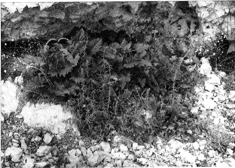
Abb. 2: Chenopodium foliosum (vorne), Ch. × tkalcsicsii (links hinten) und Ch. bonus-henricus (rechts hinten) dicht beisammen, begleitet von Silene veselskyi zu beiden Seiten.

Anlässlich einer Exkursion im Sommer 1983 in die Südtiroler Dolomiten fiel uns eine ausge dehnte Balme im Hintergrund des Edelweißtales bei Collfuschg auf, wo die Schopfige Teufelskralle ( Physoplexis comosa = Phyteuma comosum ) in prachtvollen Exemplaren aus den Fels spalten hängt und in Nischen verborgen der Dolomit-Streifenfarn ( Asplenium seelosii ) wurzelt. Auf dem Boden wachsen u. a. der auch auf Kulturland wie in Äckern häufige Weiße Gänsefuß ( Ch. album ) und der gleichfalls weit verbreitete, bis zu den höchsten Almhütten steigende Gute Heinrich ( Ch. bonus-henricus ), der früher als Gemüse geschätzt wurde, ebenso als Heil pflanze. Dazu dann der in solchen Balmen Südtirols, s. schon DALLA TORRE & SARNTHEIN (1909: 115), oder des Engadins bis in eine Höhe von 2428 m nach BRAUN-BLANQUET & RÜBEL (1933: