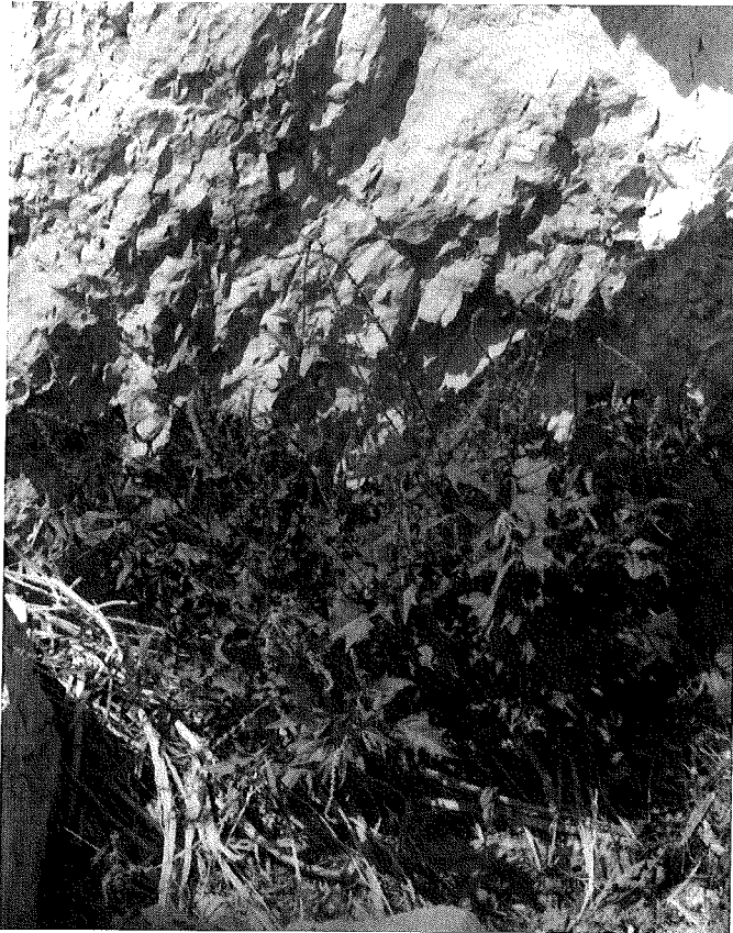
Abb. 3: Chenopodium × tkalcsicsii in einem späteren Stadium mit stark verlängerten rutenförmigen Blütenständen.

457–458) nicht so selten vorkommende Erdbeerspinat ( Ch. foliosum ). Seine Heimat hat er wahrscheinlich in Asien, doch wird er von manchen Forschern als heimisch in den Alpen angesehen, wie z. B. von BRAUN-BLANQUET (l. c.) oder nach ihm von ALLEN (1961: 605), der schreibt: „Einzig in den Alpen spontan. Das Vorkommen als Kulturpflanze oder als Überbleibsel einer Kultur erlischt im Hügelland und im Tiefland.“ Die ganze Pflanze wurde früher als Spinat gegessen, die korallenrot gefärbten, an Erdbeeren erinnernden Fruchstände sind zwar essbar, schmecken aber fad. Sie werden endozoisch, also durch Tiere – früher war es wohl auch der Mensch –, vor allem durch Vögel, verbreitet.