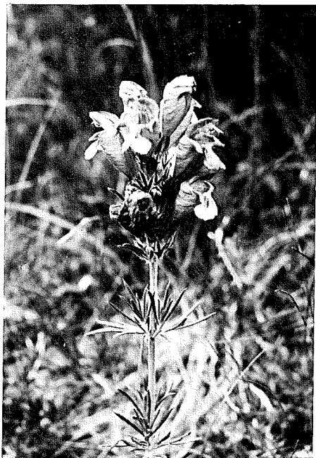
Abb. 5: Dracocephalum austriacum , sehr wahrscheinlich der einzige Wuchsort im Gebiet.