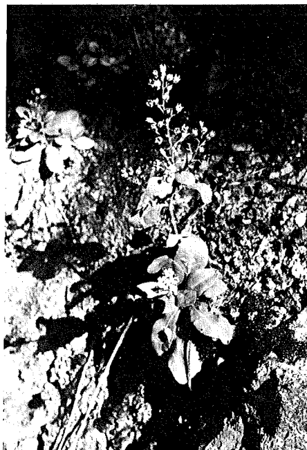
Abb. 6: Samolus valerandi , sehr selten an der Bozener St.-Oswald-Promenade.