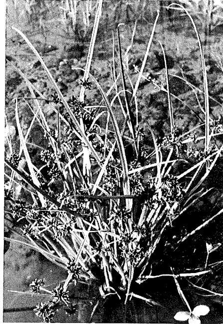
Abb. 2: Cyperus fuscus , nicht mehr häufig in Südtirol.