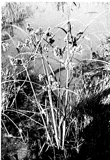
Abb. 3: Cyperus glomeratus wurde bei Burgstall neu entdeckt und durch Verbauung vernichtet.

stall (9333/3, siehe auch Abb. 3). Ein Jahr später wurde der Fundort (an der Provinzstraße neben Birkenheim) durch Verbauung vollkommen zerstört. Auch die in Dalla Torre angegebenen Wuchsplätze bei Bozen existieren heute nicht mehr.