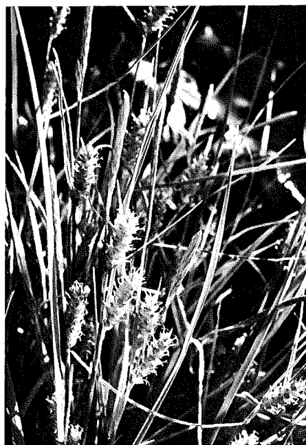
Abb. 4: Carex punctata , eine große Seltenheit bei Meran.