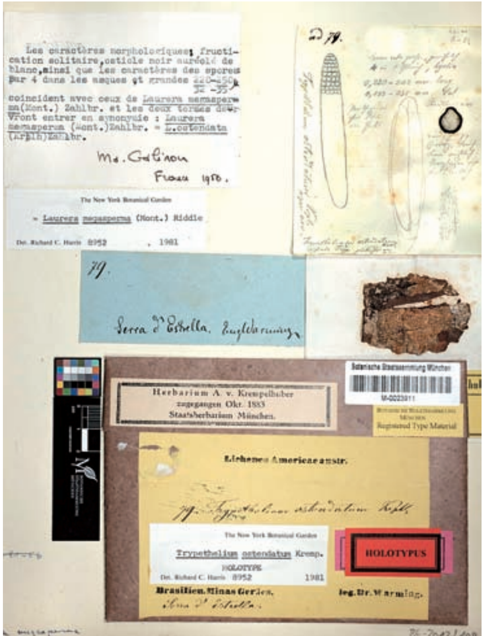
Abb. 4: Beleg aus dem Herbar Krepelhuber: Trypetelium ostendatum Krepmp.