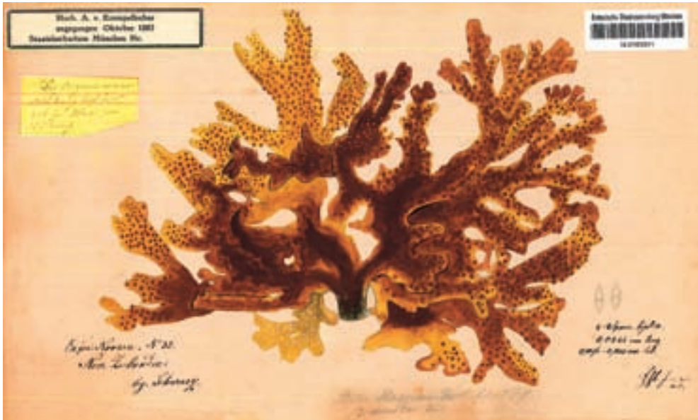
Abb. 2: Krempelhubers farbige Zeichnung von Sticta menziesii Hook. & Tayl. var. dissecta Kremp. [heute zu: Sticta latifrons A.Rich]. Diese Zeichnung war Vorlage zur Tafel XVI in Krempelhubers Bearbeitung der Flechten der „Reise der Österreichischen Fregatte Novara um die Erde in den Jahren 1857, 1858, 1859“ (KREMPELHUBER 1870).

dierte er an der Ludwig-Maximilians-Universität in München von 1832 bis 1834 Philosophie sowie anschließend bis 1836 Forstwissenschaften. Während seines Studiums wohnte er in der Sonnenstraße 2 im I. Stock in München. Am 27.4.1835 wurde seine Untauglichkeit für den Militärdienst festgestellt. Anlässlich dieser Untersuchung wurden auch seine körperlichen Merkmale protokolliert: „Größe: 5' 5" 11'" [diese Längenangaben in Fuß, Zoll und Linien ergeben umgerechnet eine Körpergröße von 1,64 m] Haare dunkelbraun[,] Stirn hohe[,] Augenbrauen braun[,] Augen grüne[,] Nase [und] Mund proport[ional]. Bart braun[,] Kinn oval[,] Gesichtsförm länglich[,] Gesichtsfarbe gesund[,] Körperbau schlank“.