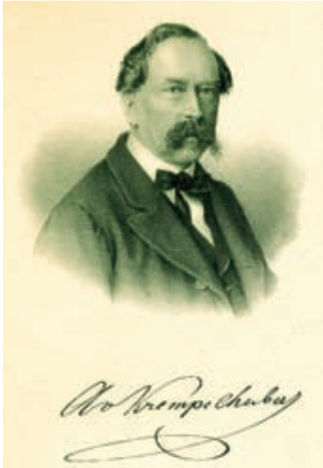
Abb. 1: Portrait von August v. Krempelhuber (aus seiner „Geschichte und Litteratur der Lichenologie“, Band 2, 1869).

Gebirgskämmen nach der scheuen Gemse spähen, oder im dichten Bergwalde auf den stattlichen Zwölfender pürschen, immer richtete ich auch zugleich – ich möchte sagen, wenigstens ein Auge – auf die sich mir zeigenden Lichenen, und selbst auf solchen Jagdstreifzügen dürfte mir wohl keine seltenere Art entgehen können. Fand ich dann eine neue, oder für Bayern noch unbekannt Species, mit welcher innerlichen Befriedigung, mit welcher Lust wurde sie dann aufgenommen!“