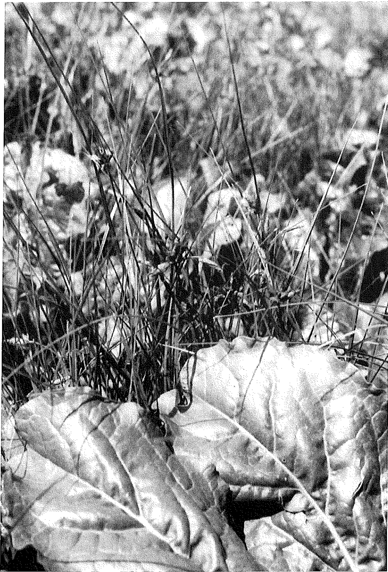
Abb.2 Massenvorkommen von Bolboschoenus maritimus in Zuckerrüben bei Schmiechen, südlich Augsburg.

Die pflanzensoziologische und ökologische Bindung von Bolboschoenus auf den Ackerstandorten in Bayern gibt Tab. 1 wieder. Die Art tritt in Mais, aber auch in Kartoffeln, Rüben und Sellerie, sowie in Winterweizen, Winter-Gerste und Hafer auf. Die Standorte sind feuchte, nährstoffreiche, basische bis schwach saure Lehm- und Tonböden mit hohem Grundwasserstand. Eine gewisse Wechselfeuchtigkeit wird getragen. Feuchte Ackersenkens besitzen häufig einen Kontakt zum Grünland, die entsprechenden Äcker sind durch Wiesenumbruch entstanden.