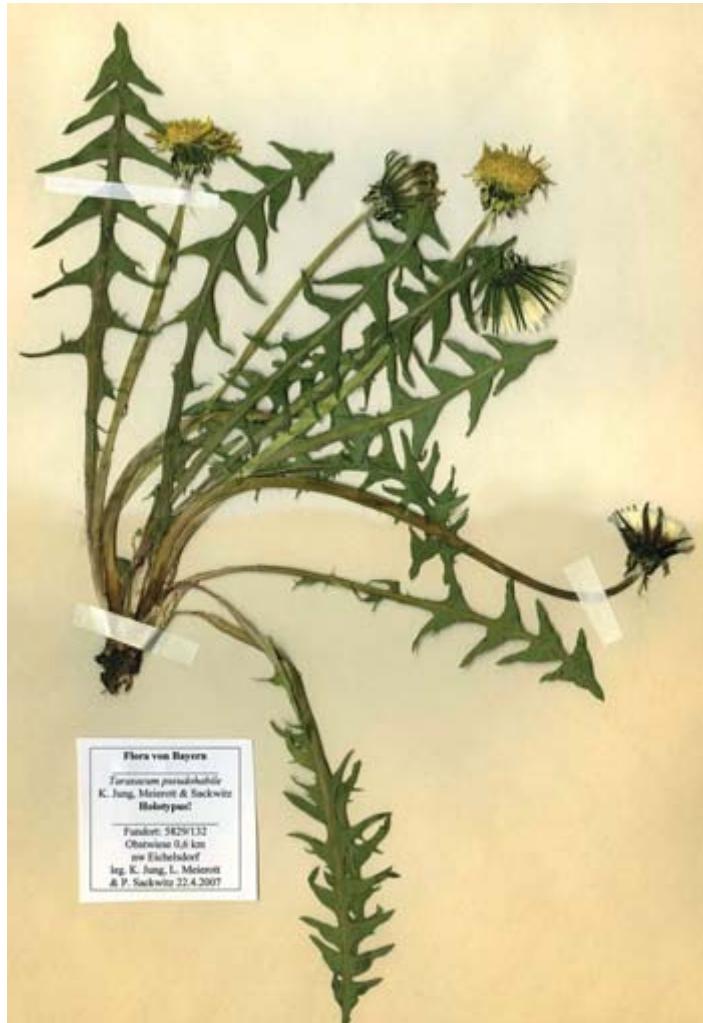
Abb. 1: Taraxacum pseudohabile K. Jung, Meierott & Sackwitz – Holotypus (M).

Anmerkungen: Taraxacum pseudohabile ist Taraxacum habile Railons. ähnlich. Dieser besitzt aber mittel- bis dunkelgrüne (nicht grau-blaugrüne) Blätter, intensiv weinrot gefärbte (nicht schwach rosafarbene) Blattstiele, einen meist etwas kürzeren und weniger zungenförmigen Blatt-Endlappen, schmälere äußere Hüllblätter und reingelbe (statt schwach schmutziggrüne) Griffel.