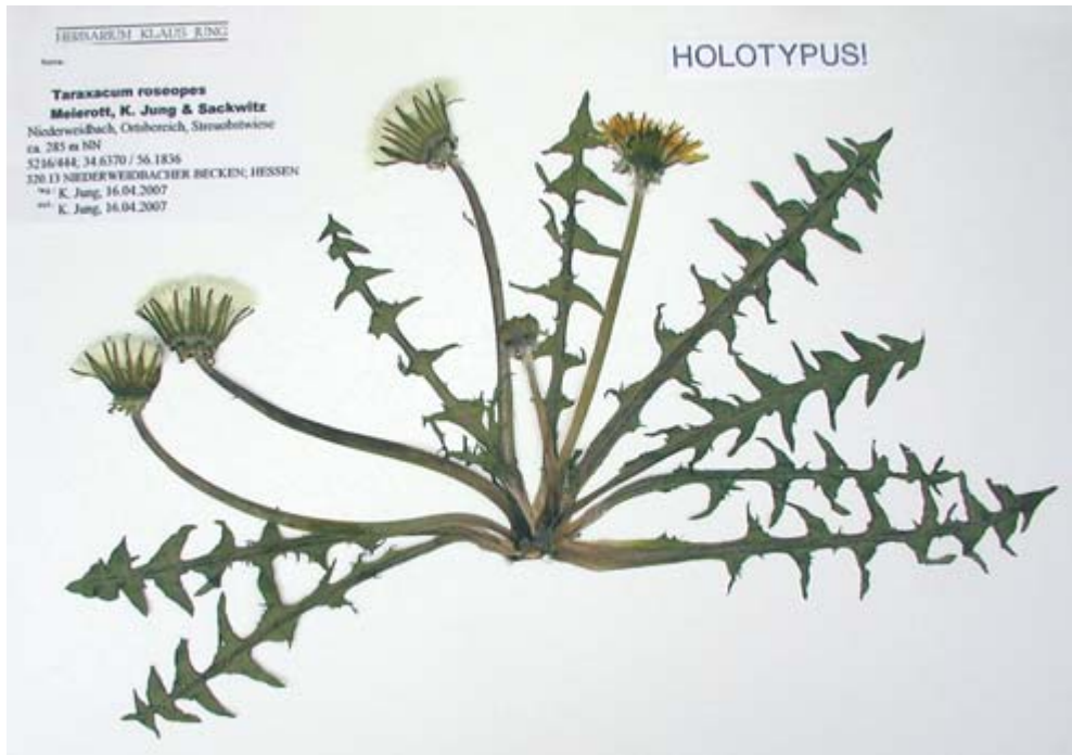
Abb. 2: Taraxacum roseopes K. Jung, Meierott & Sackwitz – Holotypus (M).

wiegend etwas breiter als lang, schmal zungenförmig zugespitzt, manchmal mit zwei parallelen Einschnitten. Interlobien zum Teil schwach teerfarben, ganzrandig oder schwach gezähnt. Stengel grün, behaart, unter dem Involucrum dichter behaart. Äußere Hüllblätter zurückgekrümmt, ca. 9,0–10,5 × 2,8–4,0 mm, unberandet, bleichgrün, gegen Ende der Blütezeit braunviolett überlaufen. Blütenkörbe ca. 40–55 mm Durchmesser, mittelgelb, Griffel rein gelb, Pollen vorhanden, Pollenkörner mit deutlich unterschiedlichem Durchmesser. Achänen strohfarben, 2,9–3,1 mm (ohne Pyramide), Achänenornen kurz bis mittellang, mäßig kräftig, gerade bis schwach aufwärts gebogen, Pyramide 0,3–0,7 mm lang, unbedornt, fast zylindrisch. Rostrum 9,0–9,4 mm lang, Pappus weiß.