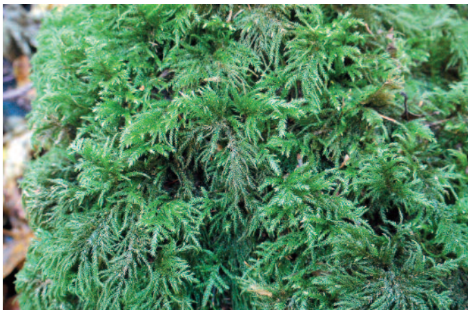
Abb. 4: Unmittelbar am Ufer des Ilmbaches wächst auf Schiefer, der vom Wasser bespritzt wird, Thamnobryum alopecurum .