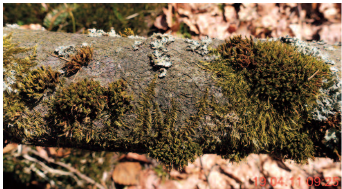
Abb. 5: Bestand des Ulotetum crispae mit Ulotetum bruchii und Orthotrichum affine .

Substrat: Ag = Alnus glutinosa , F = Fagus sylvatica .