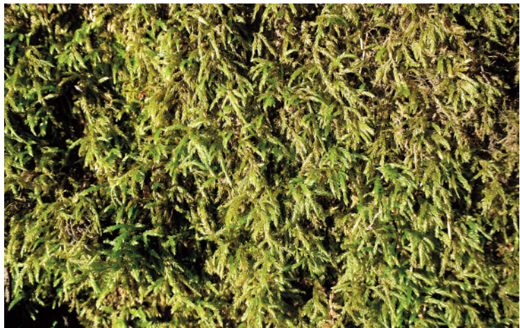
Abb. 6: Am unteren Stammabschnitt und Stammfuß von Acer pseudoplatanus gedeiht in der schmalen Aue des Ilmbaches Isothecium alopecuroides .

Substrat: As = Acer pseudoplatanus , F = Fagus sylvatica , Fx = Fraxinus excelsior , S = Schiefer.