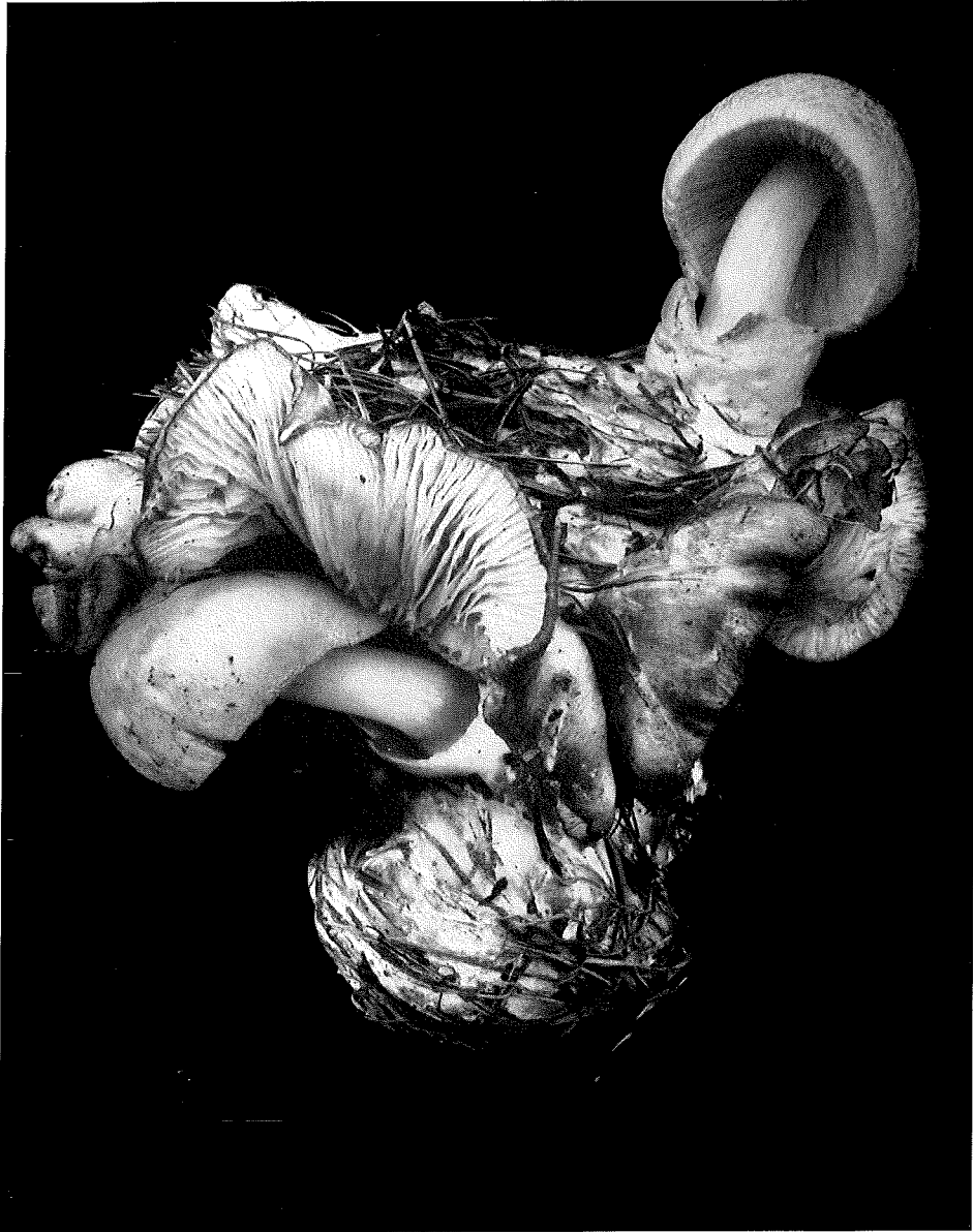
Volvariella surrecta (Knapp.) Sing. auf einem Fruchtkörper von Clitocybe nebularis (Batsch ex Fr.) Quel. parasitierend. Fundort: Altenau bei Saulgrub, Lkr. Garmisch-Partenkirchen, 28. 9. 1963. Beleg im Staatsherbarium München (M).