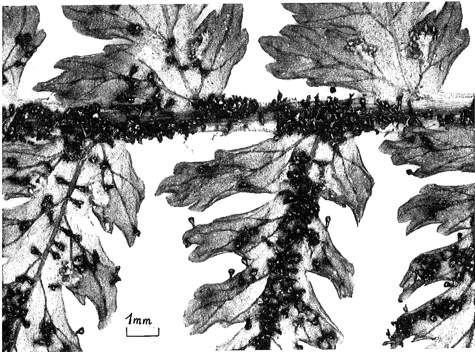
Abb. 1: Synchytrium atbyrii . Zahlreiche Pilzgallen auf der Blattunterseite von Atbyrium filix-femina . Oben rechts sind zwei Sori des Farns zu sehen.

ist meistens zu zwei, drei oder vier stumpfen Höckern ausgeformt. Junge Gallen sind durchsichtig, reife Gallen dagegen sind dunkelbraun und undurchsichtig, sie brechen relativ leicht vom Farnwedel ab. Die Bruchstelle liegt so gut wie immer am oberen Rand des basalen Teils der Galle. Dieser Basalteil bleibt nach dem Abbrechen im Verband der Epidermiszellen zurück. Die Pilzgallen finden sich an allen Blatteilen, d. h. sowohl auf der Blattober- und Blattunterseite der Spreite einschließlich der Rachis, als auch am Blattstiel; gelegentlich sind sie in den Sori zu finden. Der Befall mit Gallen ist unterschiedlich stark. Sitzen sie z. B. an einer Fieder sehr dicht, so wird die Vitalität dieses Blattstückes offensichtlich eingeschränkt, denn die betreffende Fieder bekommt eine krüppelhafte Form. In den Gallen entstehen meist eine, gelegentlich zwei, seltener drei bis vier Sporen, die eine Länge von etwa 60–100 Mikron und eine Breite von 50–70 Mikron haben. Auffallend ist, daß die Pilzgalle in ihrer Gestalt Ähnlichkeit mit den einzelligen epidermalen Drüsenhaaren der Wirtspflanze zeigt. Die Pilzgalle ist jedoch um ein Vielfaches größer als das Drüsenhaar. Es stellt sich die Frage, ob der Pilz eine Art Verstärkerwirkung hat, indem er die für die Haare formbestimmenden Gene des Wirtes beeinflusst.