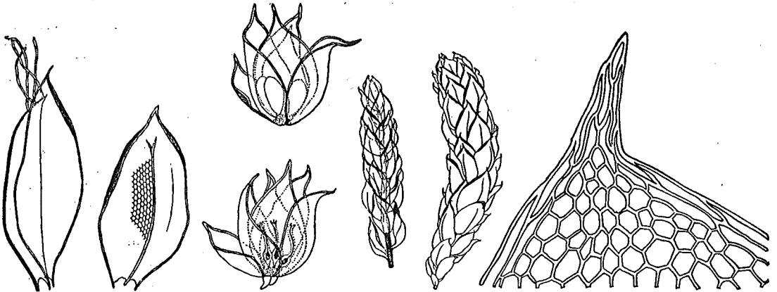
Distichophyllum carinatum Dix. & Nicols. (Von links nach rechts): Blatt mit blattbürtigen Rhizoiden — Blatt mit Zellnetz — Antheridienstand — Archegonienstand — Sproßstücke — Blattspitze.

Auf der Suche nach weiteren Fundstellen gelang es mir 1 Jahr später, im gleichen Tale, etwa 800 m bachaufwärts, eine solche festzustellen. Kaum 2 m über dem Bache wächst das Moos hier in gleicher hygrophiler Gesellschaft; diesmal allerdings auf Schrattealkalk.