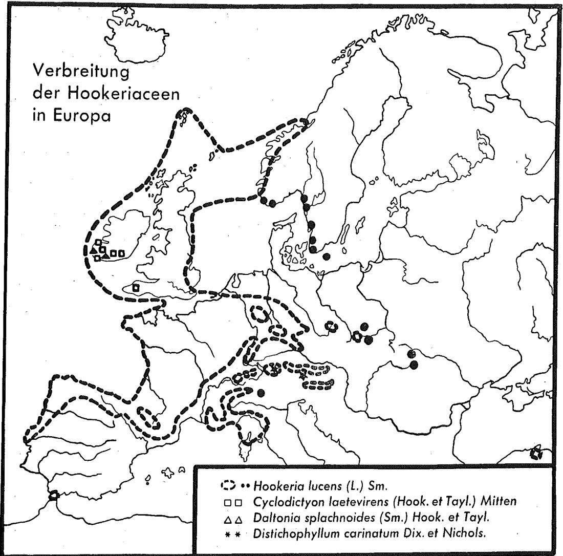
Verbreitung der Hookeriaceen in Europa